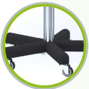
Base con cinco ruedas