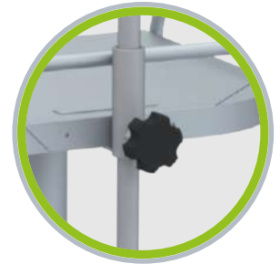
Perilla graduación altura