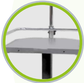
Bandeja auxiliar. Barandilla de seguridad.